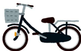
通勤用自転車・バイク等購入費