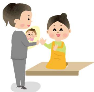
子どもを預けるための費用

※この他にもご利用いただける費用がありますので、詳細は問い合わせ先にご相談ください。