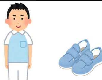
介護ウエアなどの業務用被服費等